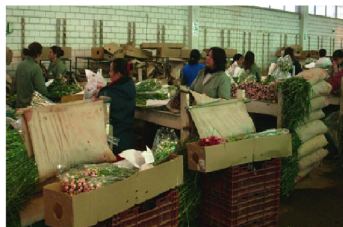
Operarias en proceso de empaque de flores para exportación.

Siendo la floricultura en Colombia, el principal mercado de agroexportación a nivel internacional, requiere de un adecuado sistema de gestión ambiental para ofrecer productos de calidad, elaborados por una industria competitiva, armoniosa y responsable con el ambiente. El Semillero de Investigación PRODUCCIÓN VERDE, en la línea de investigación "Producción más limpia" diagnosticará el proceso productivo de la finca TIBAR perteneciente al grupo JARDINES BACATÁ a sus cultivos de flores; sabiendo de antemano que este grupo de floricultores está afiliado a ASOCOLFLORES certificando las flores para exportar ante el ICONTEC por medio del esquema FLOR VERDE.