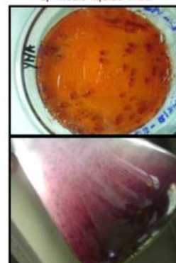
Figura 1. (Arriba) Cepas Aisladas de Rhizobium obtenidas de Trifolium repens en medio YMA, (Abajo) Suspensión de bacterias de Rhizobium e) medio líquido YMA.

El diseño experimental fue completamente al azar con cuatro tratamientos, cada uno con 21 réplicas. La bacteria fijadora de nitrógeno fue extraída y aislada de los nódulos presentes en las raíces de la planta Trébol Carretón ( Trifolium repens ) por medio de técnicas convencionales en el Laboratorio de Microbiología de la FAMARENA (Apuntes de Microbiología y Lena Carolina Echeverri, Com pers , 2007).