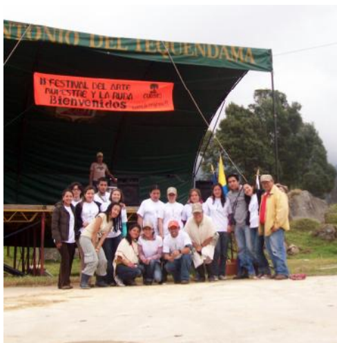
Trabajo de campo en el II Encuentro del arte rupestre y la ruda, en San Antonio del Tequendama (Cundinamarca), 2009.

La cotidianidad de las grandes ciudades de los países, capitales y centros urbanos, se centran en la industria, en la vida comercial, en prestación de servicios, y muy ocasionalmente las personas se inquietan por las realidades de los entornos que hacen posible la existencia de dicho confort; de los lugares que complementan las actividades de los centros urbanos. Generalmente cuando se habla de desarrollo en el país se menciona lugares como Bogotá, Medellín, o Cali dentro de las mas sobresalientes, sin tener en cuenta el papel tan fundamental que desempeñan los territorios aledaños a dichas ciudades en el desarrollo de las mismas, y es que finalmente lo rural es a lo urbano como un árbol a su semilla, sin el primero no existe el segundo.