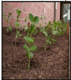
Figura 2. Plantas de Pisum sativum recién inoculadas, una semana después de su germinación.

Una vez identificado el microorganismo, se procedió a la producción de biomasa de la bacteria en medio de cultivo líquido YMA (Figura 1). Producida la biomasa, se procedió a la preparación de los tratamientos, mediante diluciones consecutivas así: T0= Tratamiento Control (Sin Inóculo), T1= 7,25 \times 10^9 bacterias/ml. T2= 3,26 \times 10^9 bacterias/ml, y T3 = 5,00 \times 10^8 bacterias/ml.